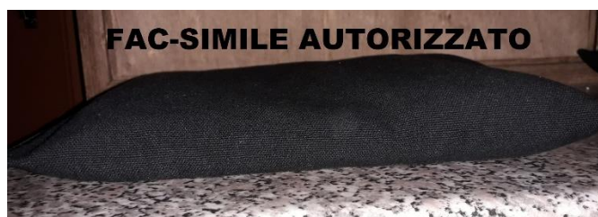
BANDIERINA DI SICUREZZA (esempio bandierina)