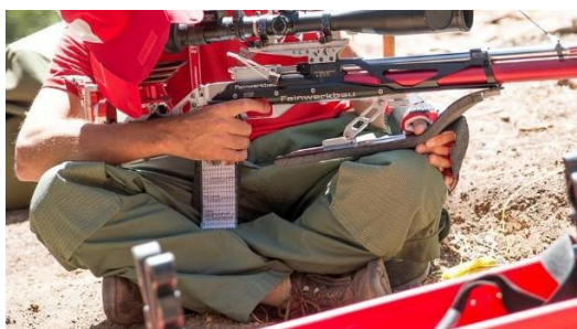
Figura 1 – Posizione dell'uomo morto.

Questo significa che non c'è un appoggio supplementare, ma solo uno scambio di punti di appoggio.