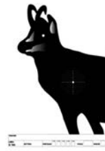
Specialità 200 mt – Tiro con appoggio