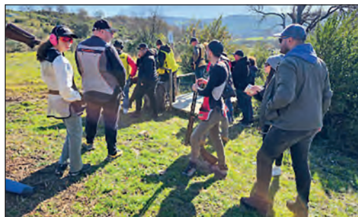
© Centro federale Fidasc Coni Campagna