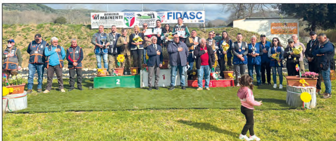
Tiro a palla: squadre regionali con presenza Lady sul podio