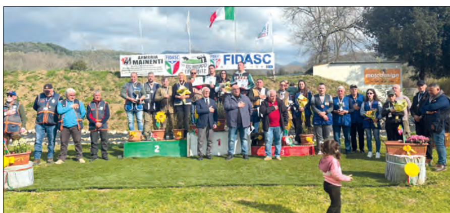
Prime 5 squadre classificate