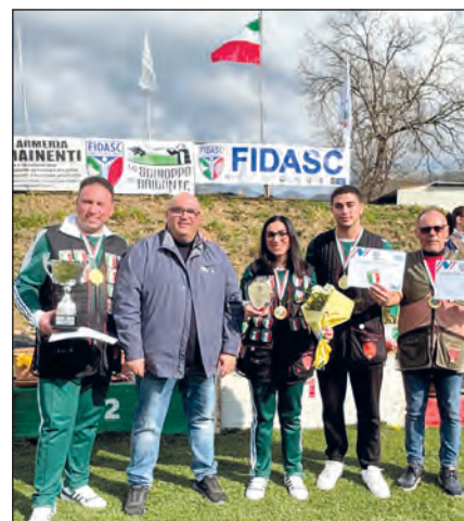
Prima squadra classificata e Miglior Lady