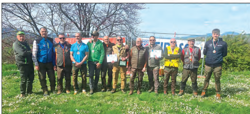
1° Campionato Praemium squadre regionali