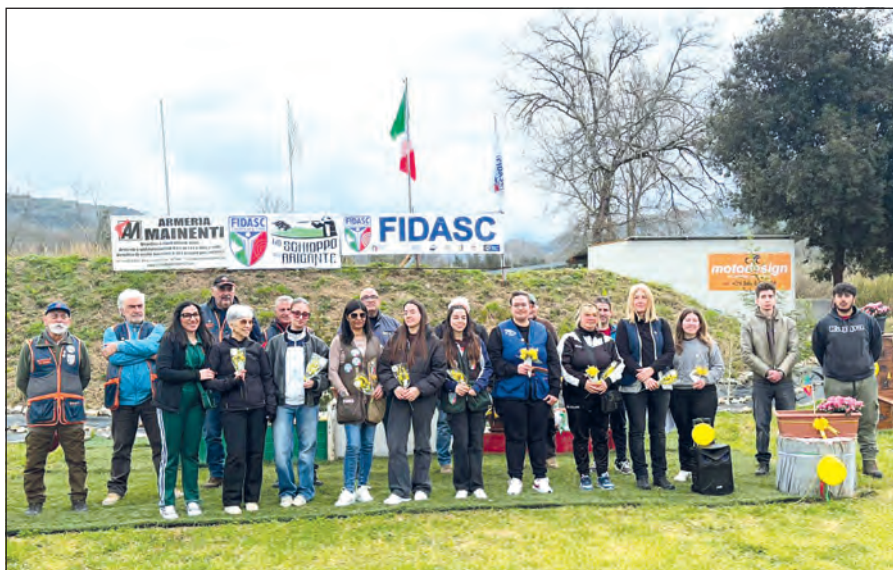
Le Lady premiate

Sabato lo start è scattato per le squadre campane: il team della Toscana