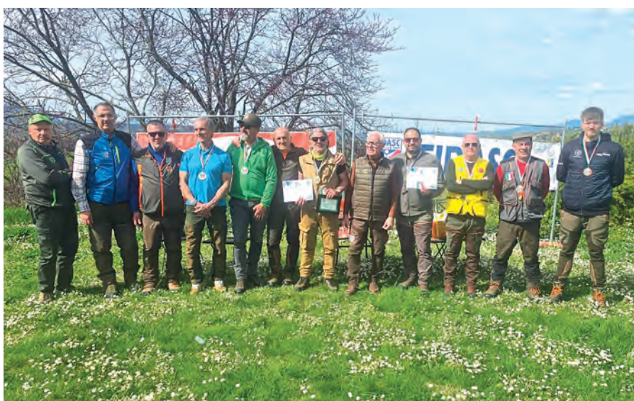
Le prime 3 squadre classificate nella categoria Inglesi: al centro la formazione della Puglia, campione d'Italia

La manifestazione si è conclusa con grande partecipazione e soddisfazione: ha rappresentato un importante momento di sport, confronto e amicizia tra i Comitati regionali Fidasc. Comitati ai quali va un ringraziamento speciale per aver aderito con entusiasmo, iscrivendo 10 squadre della categoria Inglesi nella giornata di domenica e 7 della categoria Continentali esteri e italiani il sabato. La partecipazione è stata pertanto numerosa e qualificata, contribuendo in maniera determinante alla riuscita di questa prima edizione. A classificarsi squadre campioni d'Italia, con i più sinceri complimenti del delegato Trani e dello staff federale presente, la