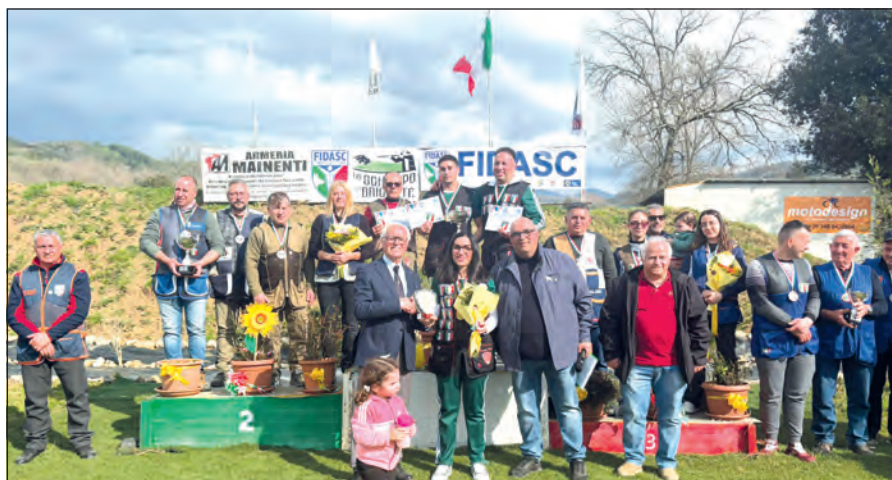
Podi e Miglior Lady