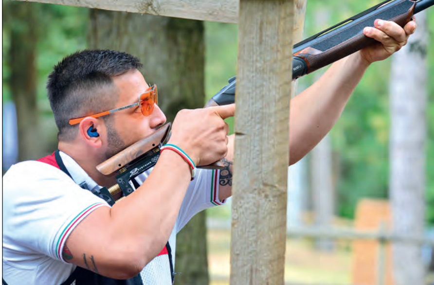
Una delle caratteristiche che rende questa disciplina particolarmente tecnica è il fatto che si sparano sempre coppie di piattelli (le cosiddette 'coppiole') e mai piattelli singoli

"Negli ultimi anni l'english sporting ha registrato una crescita costante sia in termini di partecipazione che di interesse da parte dei tiratori. Sempre più