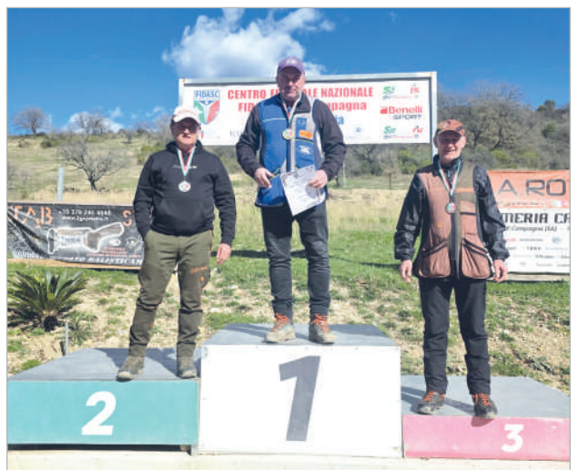
In questa galleria di immagini i terzetti delle categorie e qualifiche che sono andati ad occupare i gradini dei podi