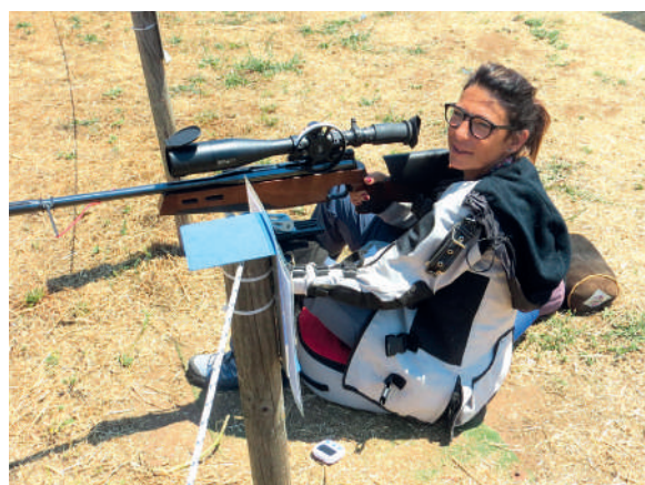
L'attività promozionale per far conoscere la disciplina quest'anno verrà come ormai consuetudine assicurata da una serie di Open days in tutta Italia