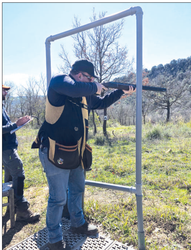
Una volta chiuso il sipario sul Campionato italiano, si è svolto il raduno dei probabili qualificati alla squadra nazionale che nel prossimo mese di aprile rappresenterà l'Italia al Campionato del mondo della specialità, in programma in Texas