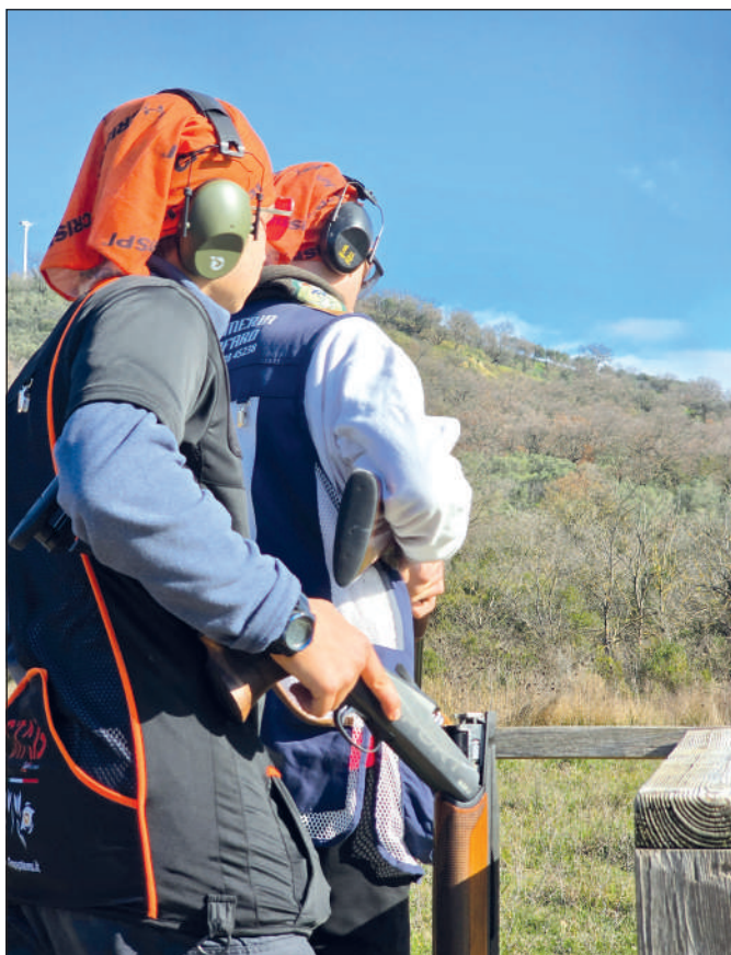
Il percorso di gara si è articolato su 12 piazzole di tiro, studiate per esaltare tutte le peculiarità dell'english sporting. Alternanza di piattelli lunghi con il nero e piattelli corti arancio, tutti perfettamente visibili e ben leggibili