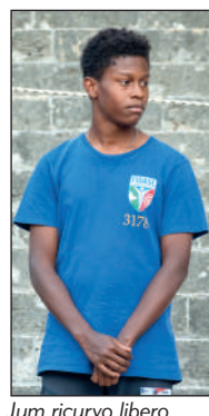
Juv ricurvo libero 3° classificato