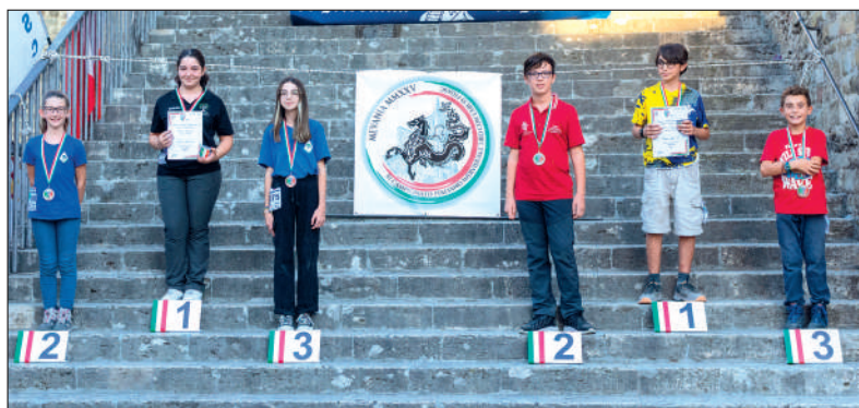
Caw e Cam ricurvo tradizionale