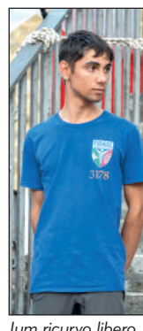
Juv ricurvo libero 2° classificato