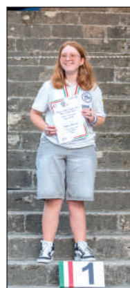
Juv ricurvo tradizionale