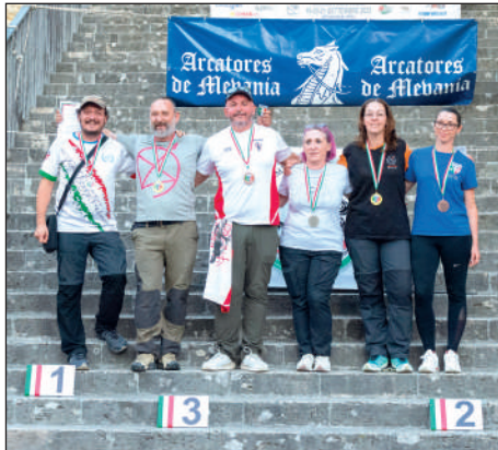
Man e Wom compound assistito