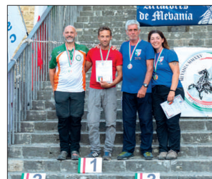
Man ricurvo libero e Wom ricurvo assistito