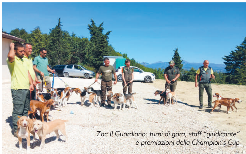
Zac Il Guardiano: turni di gara, staff "giudicante" e premiazioni della Champion's Cup