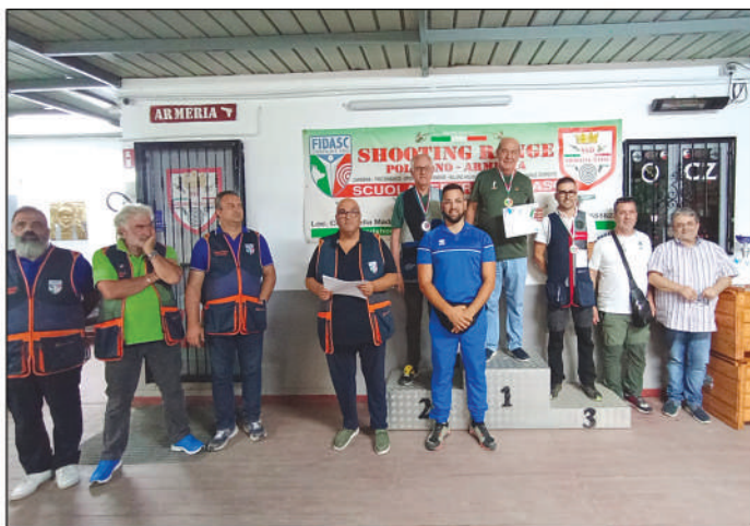
Tiro di campagna: 8° Campionato italiano 300 mt Open