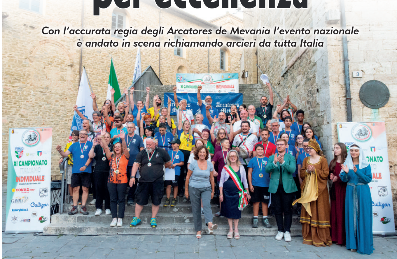
Bevagna (Pg): tutti i medagliati della manifestazione tricolore

Con l'accurata regia degli Arcatores de Mevania l'evento nazionale è andato in scena richiamando arcieri da tutta Italia