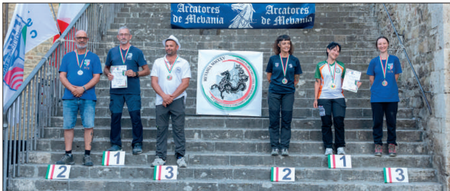
Man ricurvo assistito e Wom ricurvo libero