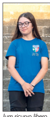
Juv ricurvo libero 1° classificata