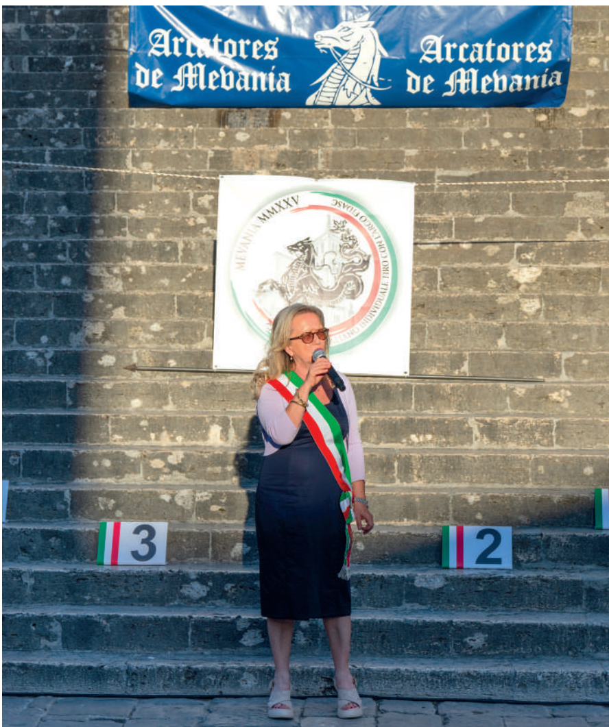
Annarita Falsacappa, sindaco di Bevagna