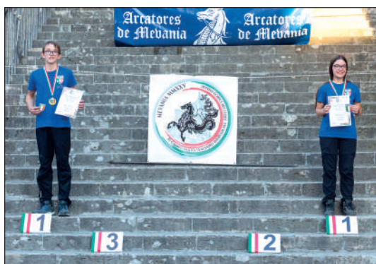
Jum e Juv ricurvo assistito