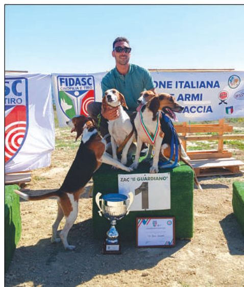
Cinofilia: la prima edizione della Champion's Cup