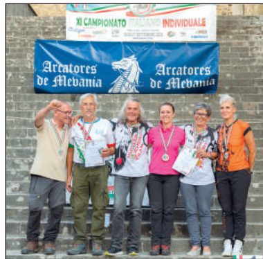
Man e Wom ricurvo tradizionale