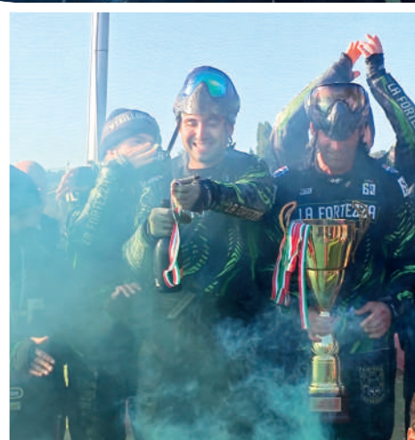
I trionfatori del Campionato italiano 5 Men: i componenti de La Fortezza. Alle loro spalle si sono piazzate le squadre dei Black Wolf e dei Rangers