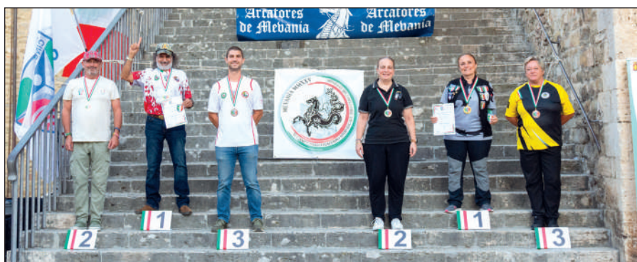
Man e Wom arco storico