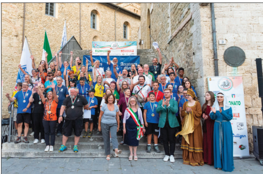
A Bevagna l'11° Tricolore individuale di tiro con l'arco