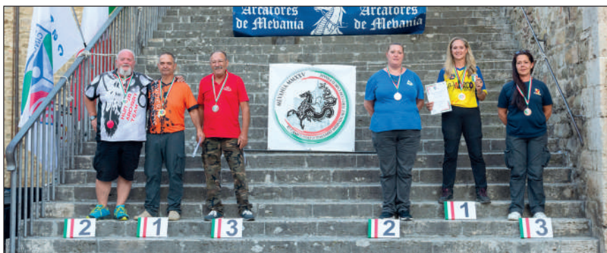
Man e Wom storico libero