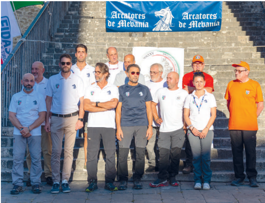
Lo staff degli Arcatores de Mevania