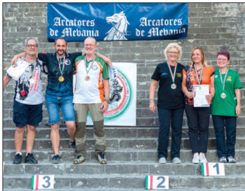
Man e Wom longbow