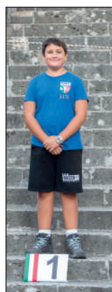
Cam ricurvo assistito