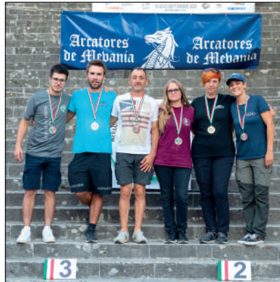
Man e Wom compound libero