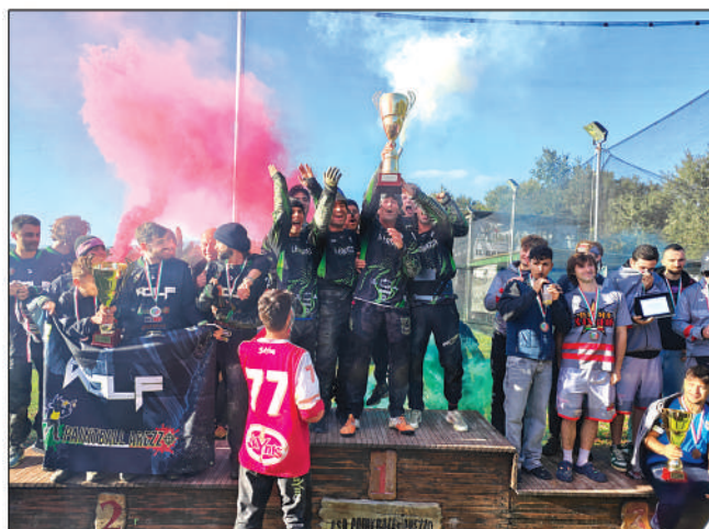
Paintball: al team de La Fortezza il titolo nazionale 5 Men 2025