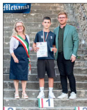
Jum compound libero