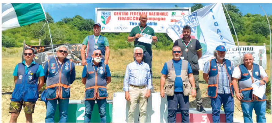
I premiati della categoria Eccellenza