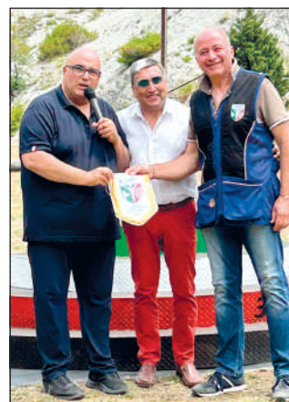
Durante la cerimonia di premiazione, ancora una volta condotta da Francesco Citriniti, sono stati estesi ringraziamenti ufficiali all'Amministrazione comunale di Sala Consilina, rappresentata dal vice sindaco e dall'assessore allo Sport

ne dall'Asd Sala Consilina, su incarico ufficiale della Fidasc, ha regalato 2 giornate all'insegna dello sport, dell'agonismo e della condivisione tra atleti di diverse età ed esperienze, provenienti da Campania, Calabria, Toscana e Basilicata.