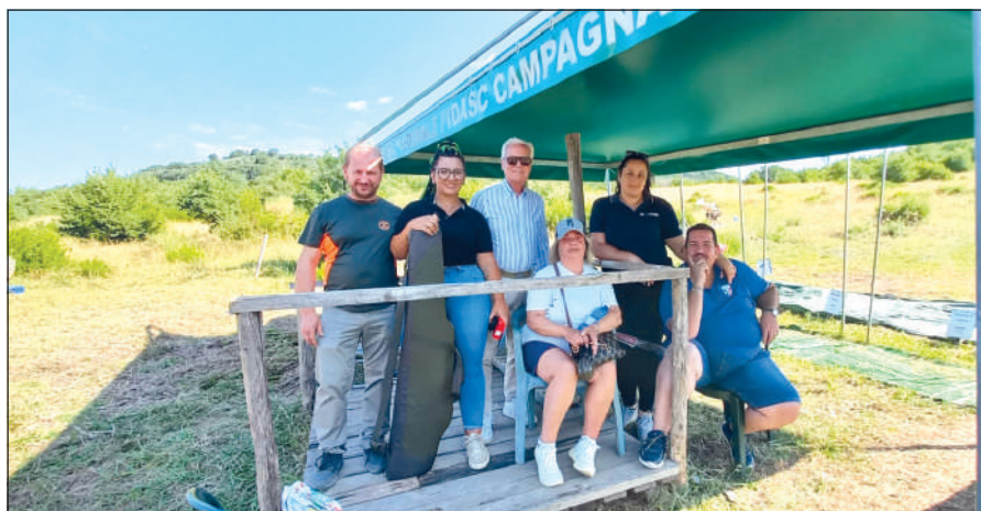
Il presidente federale tra gli atleti durante le prove