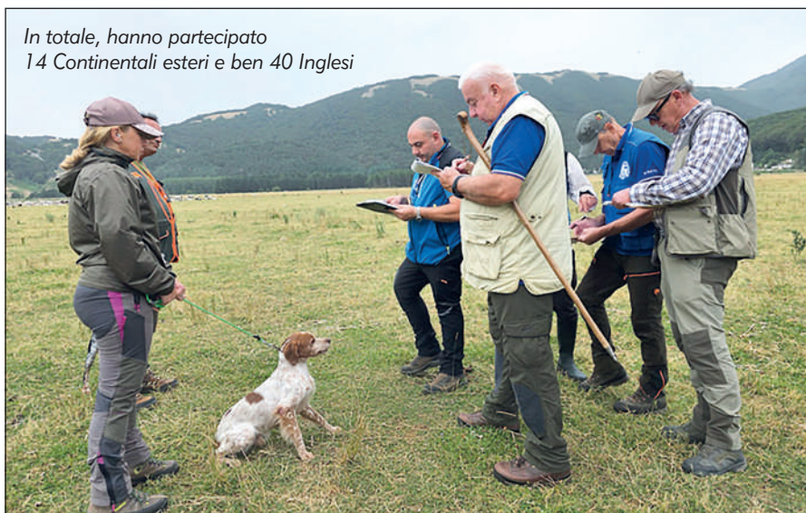
In totale, hanno partecipato 14 Continentali esteri e ben 40 Inglesi

S ull'incantevole altopiano del Lago Laceno a Bagnoli Irpino (Av), si è disputato il Campionato italiano Premium su quaglie, una delle manifestazioni più attese dagli appassionati della cinofilia da ferma. La suggestiva location ha fatto da cornice a 2 giornate di gare intense (seppur rispettando gli orari stabiliti per il benessere animale, anche se alle ore 10:00 c'erano solo 15 °C), che hanno visto protagonisti solo i migliori cani selezionati attraverso qualificazioni regionali e interregionali, con un punteggio minimo di accesso fissato a 61 punti. Il sabato è stato dedicato alla categoria dei Continentali esteri, mentre la domenica ha visto in campo gli In-