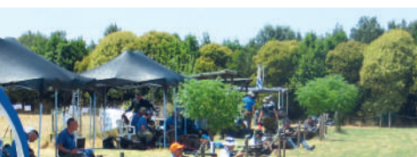
Le premiazioni, pause per uno scatto di gruppo e azioni di gara del 4° Campionato italiano a squadre per Società di field target