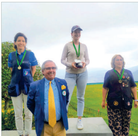
Il podio Lady all'Europeo