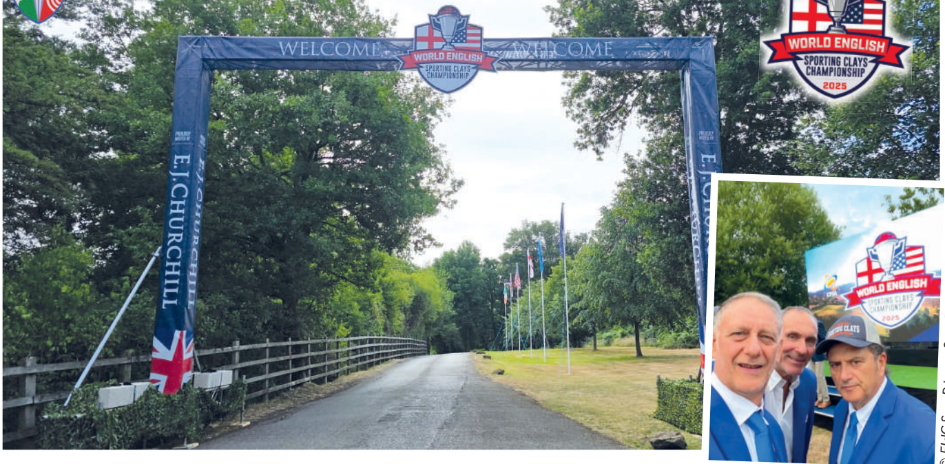
© FIdC San Prisco - Sez. Francesco Di Monaco