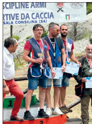
A concorrere sono intervenuti atlete e atleti provenienti da Campania, Calabria, Toscana e Basilicata