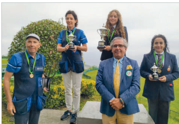
Il podio individuale Lady nel Grand Prix Fedecat