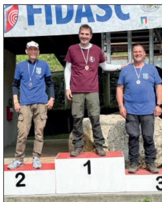
Man ricurvo libero.