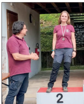
Woman compound libero.