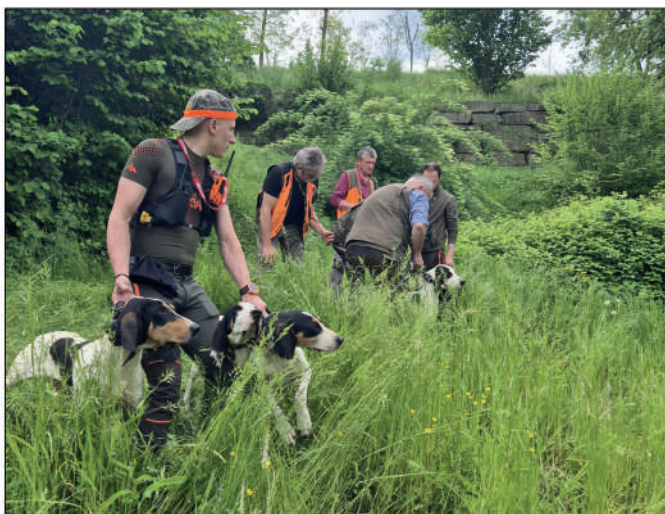
25° Campionato italiano Assoluto su cinghiale categoria mute