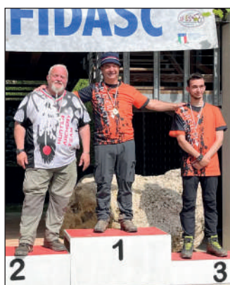
Man storico libero.