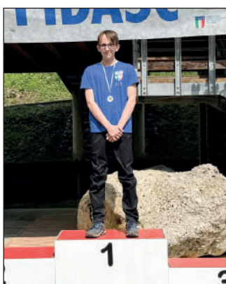
Junior maschile ricurvo assistito.