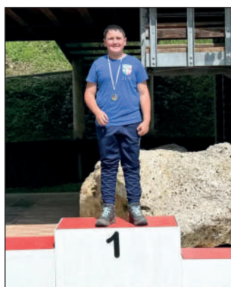
Cadetti maschile ricurvo assistito.