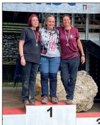
Woman arco storico.