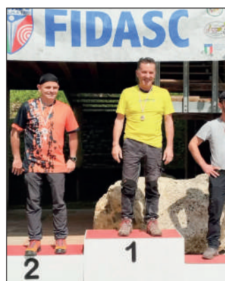
Man compound assistito.

Il Parco San Floriano di Polcenigo (Pn) ha incorniciato la tappa conclusiva del circuito destinato a individuare gli arcieri da convocare alla gara di selezione della squadra nazionale.