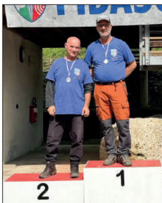
Man ricurvo assistito.