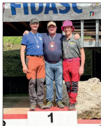
Man ricurvo tradizionale.