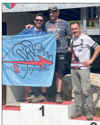
Man compound libero.

Il Parco San Floriano di Polcenigo (Pn) ha fatto da degna cornice all'ultima delle 7 gare in programma del circuito destinato a individuare gli arcieri da convocare alla gara di selezione della squadra nazionale del 28 e 29 giugno in Valsamoggia (Bo). Il ranking non lascia più dubbi su chi riceverà la lettera di convocazione nei prossimi giorni (nel momento in cui stiamo scrivendo - Ndr): ai campioni italiani 2024 la mail è già stata spedita e a stretto giro si completeranno gli invii. La classifica finale evidenzia ciò che si affermava già su queste pagine: le sorprese ci possono essere sino all'ultima freccia scoccata. La gara conclusiva, organizzata dall'Asd Archi nel Bosco, con i suoi tiri sfidanti e mai scontati, è stata apprezzata dagli oltre 100 arcieri partecipanti che si sono goduti anche la piacevolezza del paesaggio e del bosco attraversato. Un grosso plauso alla Asd organizzatrice che, in piena emergenza a causa dell'e-