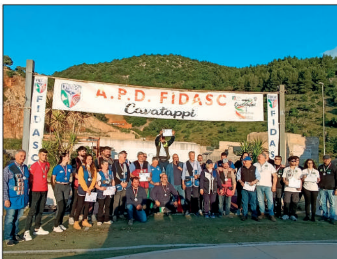
21° Campionato italiano 100mt 4 posizioni