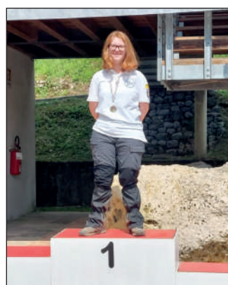
Junior femminile ricurvo tradizionale.