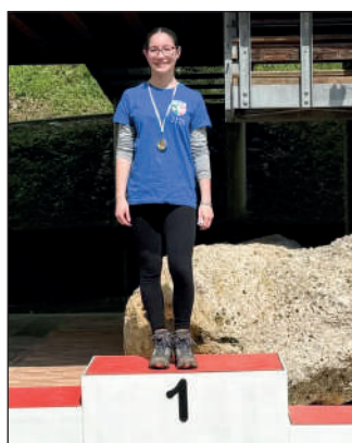
Cadetti femminile ricurvo assistito.