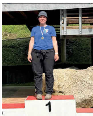
Woman ricurvo assistito.