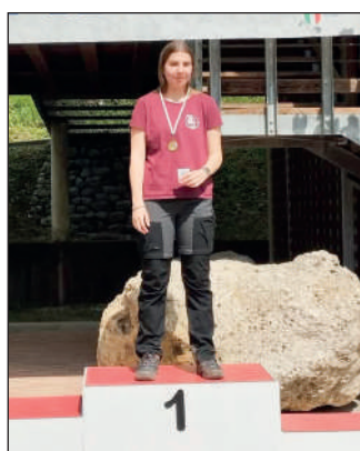
Junior femminile ricurvo libero.