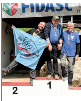
Man arco storico.