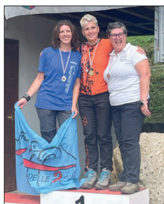
Woman ricurvo tradizionale.