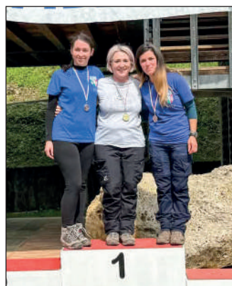
Woman compound assistito.