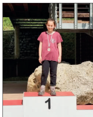
Cadetti femminile ricurvo tradizionale.

per fortuna tranquillamente praticabile. La formula regolamentare della Coppa Italia, che prevede in prevalenza tiri in coppia, ha permesso di completare la gara in poche ore lasciando quindi spazio al "terzo tempo" conviviale, ma anche ai confronti sui punteggi conseguiti, se utili o meno a scalare posizioni di classifica generale provvisoria. Chi per pochi punti non è arrivato nei primi 4 posti in classifica generale (le classifiche sono consultabili online sul sito Fidasc - Ndr) può ancora sperare in un ripescaggio in caso di rinuncia