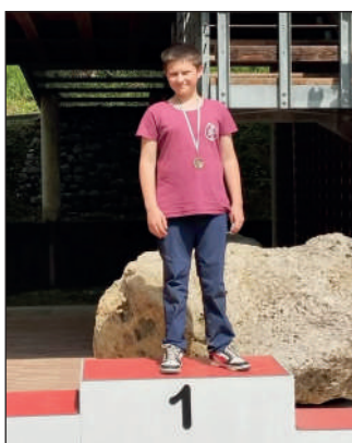
Cadetti maschile compound libero.