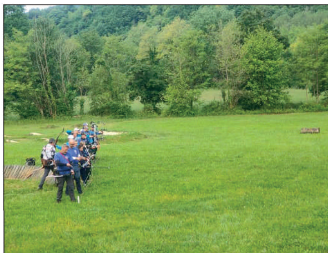
Tappa finale Coppa Italia - International Round