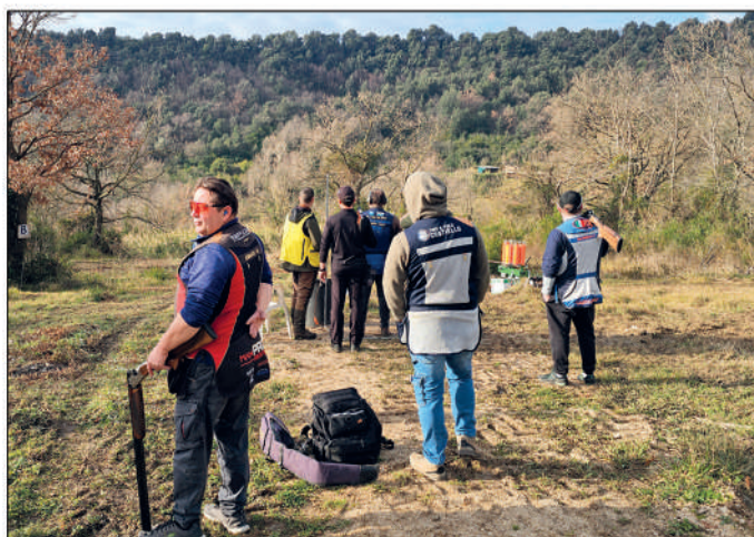
1° Gp di english sporting