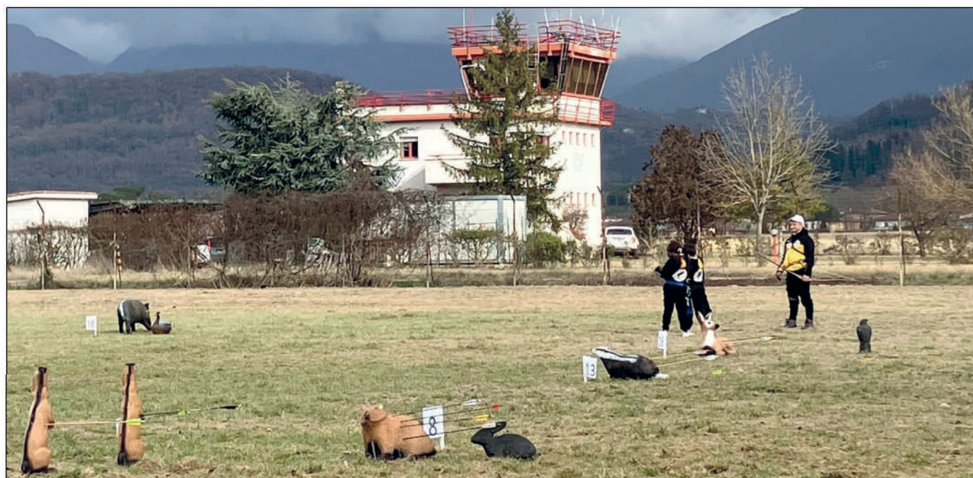
Una gara amichevole nel segno Fidasc