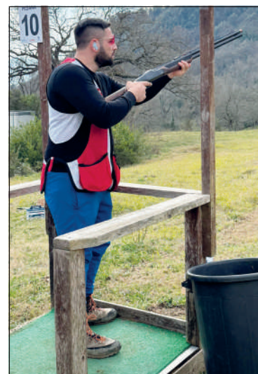
L'ottimo campo così come i piattelli molto tecnici e belli sono stati particolarmente apprezzati dai tiratori partecipanti.