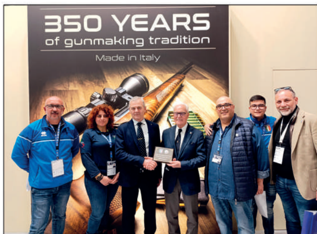
La Federazione presente a Eos 2025