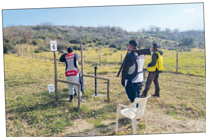
Il percorso di gara si è snodato per circa un chilometro. La manifestazione è stata organizzata dall'Asd Silaris.