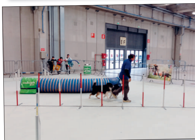
A Verona sono state allestite per l'occasione 2 aree dimostrative dedicate al paintball e alle esibizioni di agility.