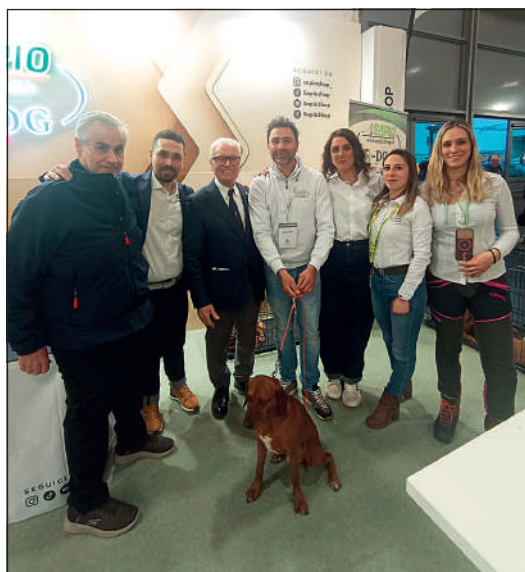
La delegazione federale durante il passaggio agli stand delle aziende espositrici.