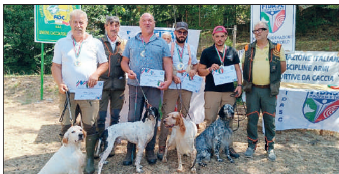
Squadra della Toscana, prima classificata negli Inglesi.