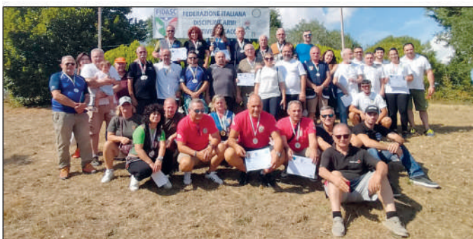
2° Tricolore 200mt sagoma di camoscio