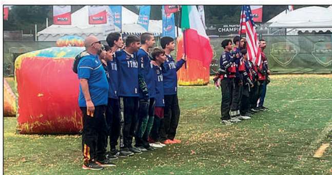
La trasferta iridata del paintball