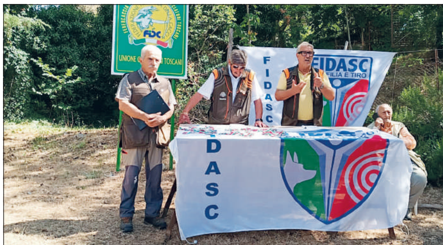
Zona federale di Collacchioni: fasi delle relazioni dei turni nella categoria Inglesi.

La manifestazione su selvaggina naturale si è articolata lungo i terreni della Zona federale di Collacchioni.