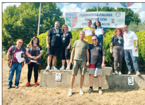
Coppie di genere.