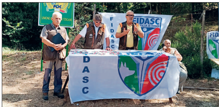
25° Campionato italiano Assoluti su selvaggina naturale