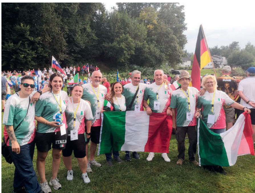
A Moosburg la squadra nazionale ha collezionato 6 ori, 2 argenti e 4 bronzi, mentre la rappresentativa extra nazionale 7 ori e 5 argenti.

reciproco, ma anche concentrazione, autodisciplina, il tutto permeato dal divertimento ed allegria che occasionali come queste instillano negli arcieri. Un grande grazie quindi a tutti i nostri arcieri, partendo dai nostri rappresen-