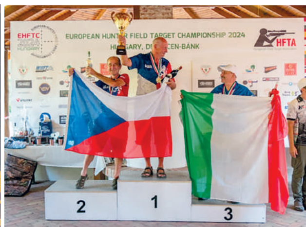
La nazionale azzurra e il podio Veteran.