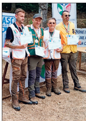
Squadra della Lombardia, Continentali.

ze di svolgimento di turni di gara nel corso dei quali consentire al binomio cane-conduttore di esprimere al massimo livello le qualità naturali, il grado di addestramento e la necessaria intesa venatica.