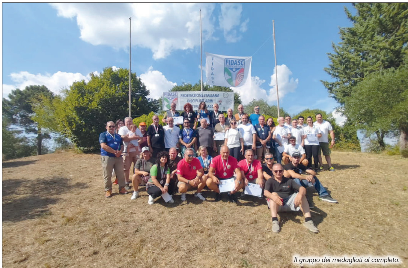
Il gruppo dei medagliati al completo.

A Lucignano, sede del Campionato italiano, l'organizzazione è stata impeccabile, così come l'accoglienza riservata agli atleti provenienti da più regioni.