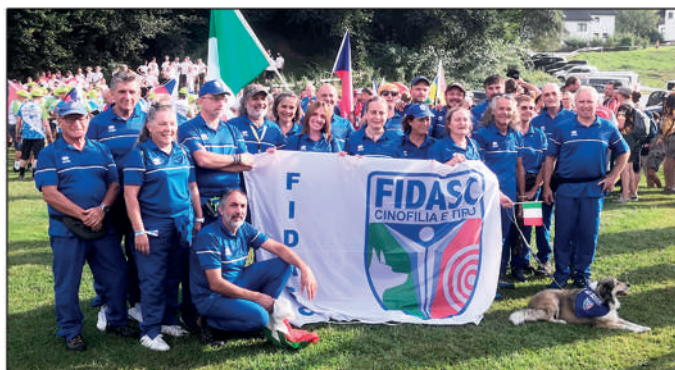
Il Mondiale 3D di Moosburg