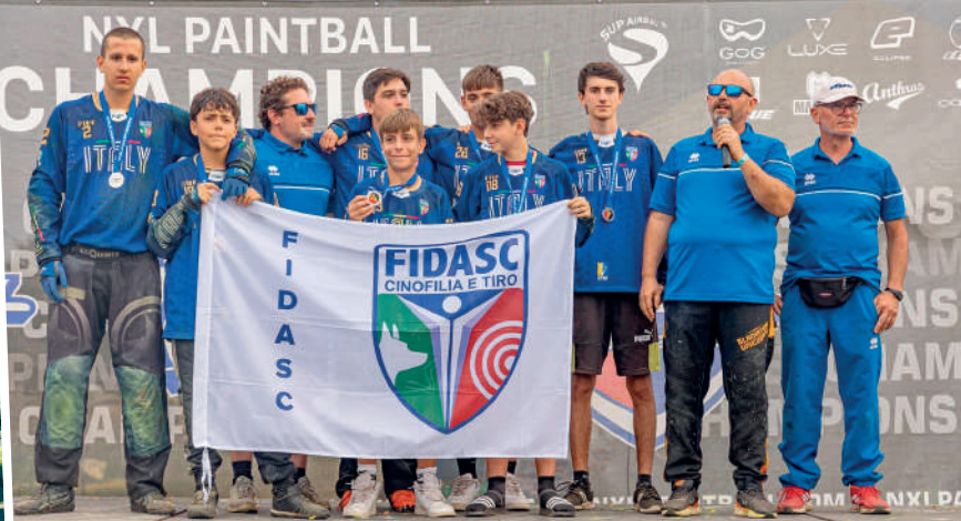
Le aspettative della vigilia sono state soddisfatte dall'argento del team U16, vice campione del mondo alle spalle di Usa e davanti ai padroni di casa francesi.