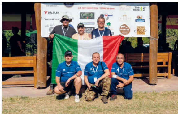
Hunter field target: l'Europeo ungherese