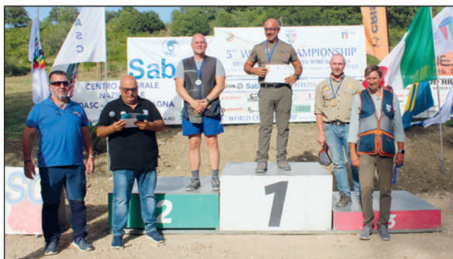
5° Mondiale e 4° Trofeo Bruno Modugno