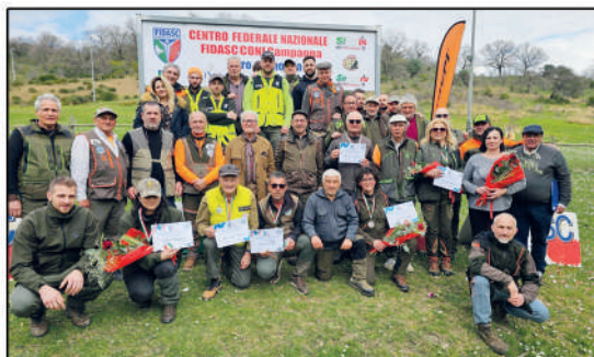
21° Campionato italiano seguita su lepre Mute e Lady in coppia