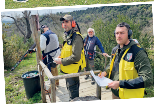
Il secondo "round" del Gran premio Lucania, sulla distanza di 100 piattelli, è stato curato nei minimi dettagli dall'Asd Fidasc Silaris.