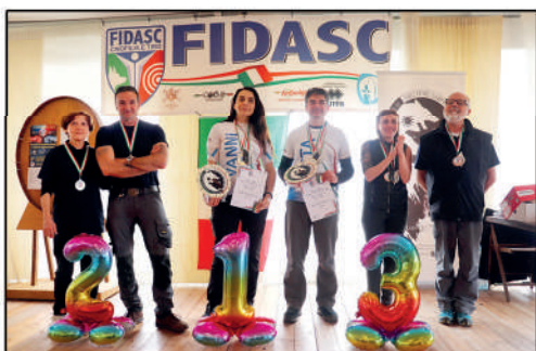
Tiro con l'arco: 6° Tricolore Binomio di genere