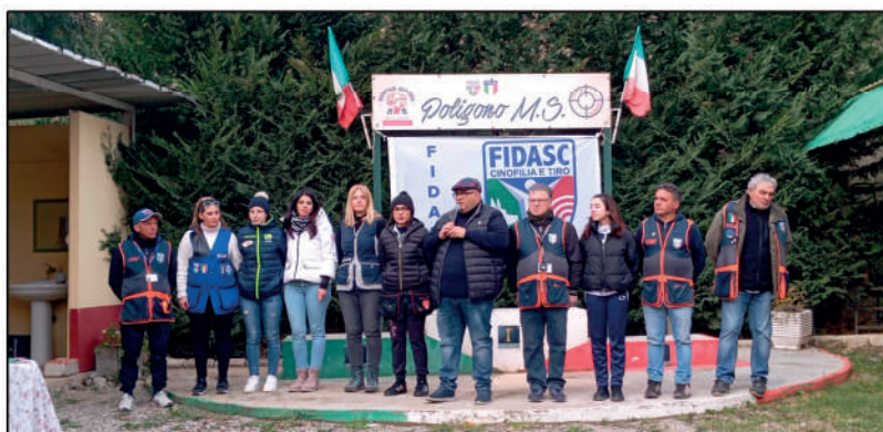
Tiro a palla: 6° Invernale Open squadre regionali con presenza Lady