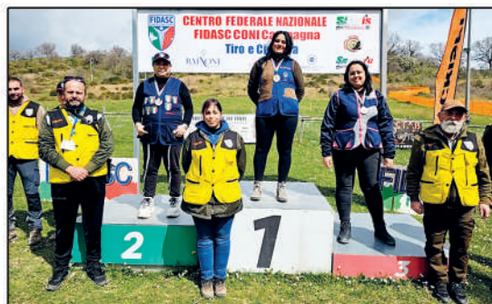
English sporting: 2° Gran premio Lucania