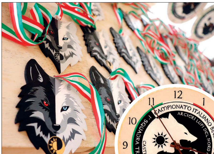
Le medaglie e gli orologi/targa sono stati realizzati da Melisandre - Noi, l'Arte e il Legno.