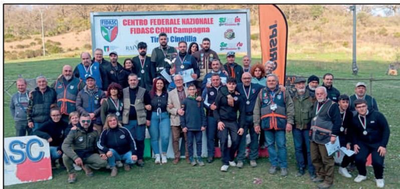
Tiro di campagna: 10° Tricolore invernale Completo Open