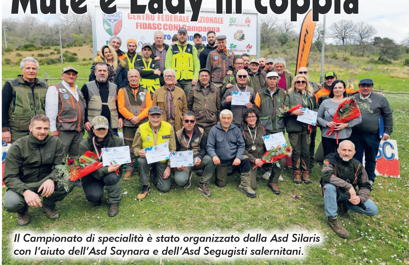
Il Campionato di specialità è stato organizzato dalla Asd Silaris con l'aiuto dell'Asd Saynara e dell'Asd Segugisti salernitani.