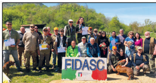
1° Campionato Open Alpenlaendische Dachsbracke