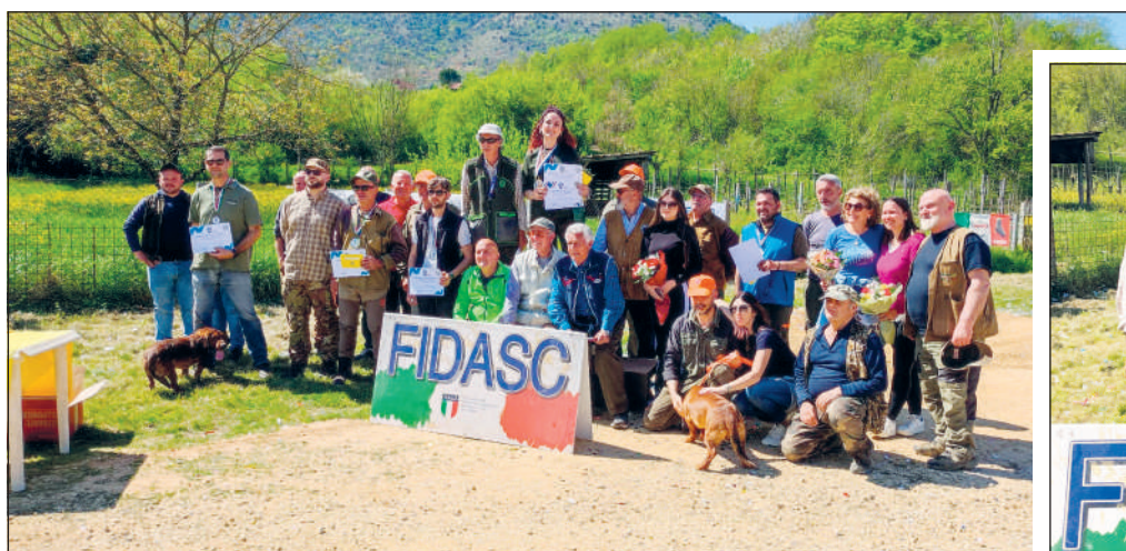
Tra le note più che positive registrate durante la manifestazione, le qualità espresse dai binomi partecipanti nei rispettivi turni, oggetto di complimenti da parte dei direttori di gara.

Il 1° Campionato Open - categorie A e B - di questa razza di origine austriaca, si è articolato in 3 giornate molto intense e partecipate.