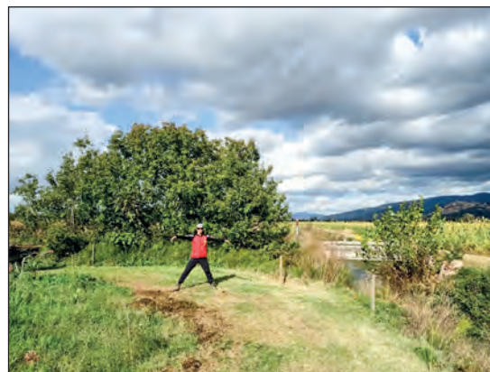
Splendida la location scelta: trail perfetto e veloce. Impeccabile l'organizzazione.