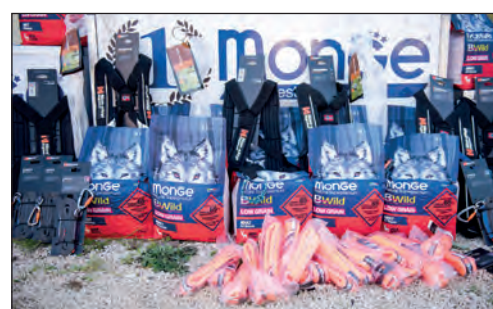
Il Campionato si è svolto senza sponsor, con il supporto però in materiali per gli atleti e per la gara donati da alcune aziende.

minuti lo staff ha rimesso in sicurezza il percorso. Nonostante le condizioni climatiche abbastanza "ostiche" - pioggia, nevischio e vento forte - il percorso era praticabile e gli atleti hanno disputato un'ottima prima manche. La domenica è stata invece caratterizzata da temperature scese a - 6 gradi durante la notte, fortunatamente però la giornata di alta pressione e l'assenza di vento hanno portato insieme al sole un po' di tepore. Nel complesso il Campionato, che ha beneficiato di una location splendida, si è connotato per un trail perfetto e veloce. Alle pre-