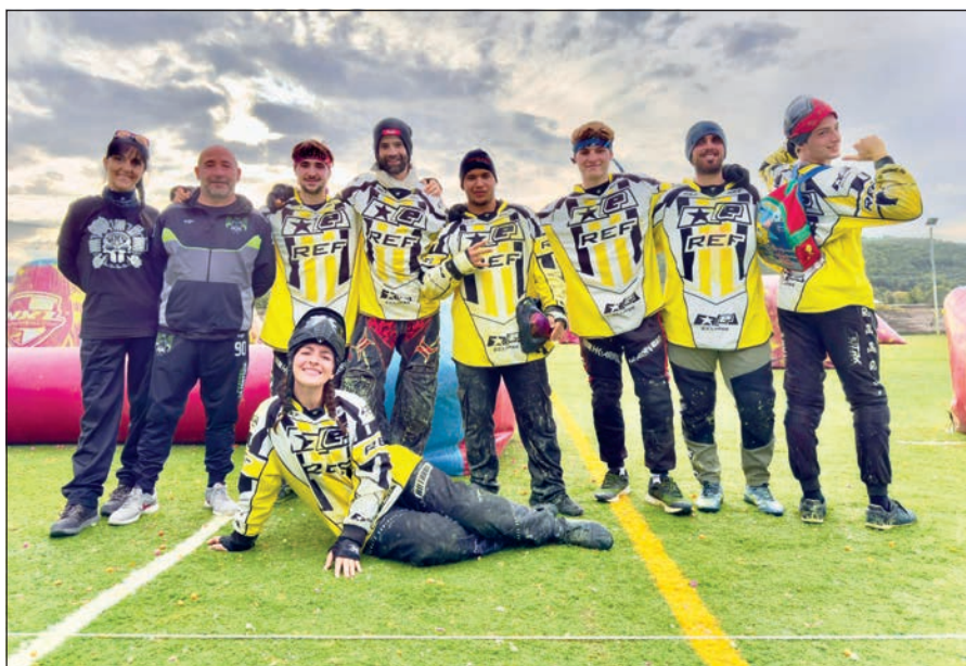
All'evento hanno partecipato quasi 100 tesserati Fidasc, tra atleti e ufficiali di gara.

L a finalissima Fidasc Paintball 3 Men - organizzata in partenariato con Ssd Sports Investments - è stata ospitata sul campo attrezzato dell'Asd Paintballs Arezzo di Lucignano (Ar). All'evento hanno partecipato quasi 100 tesserati Fidasc, tra atleti e ufficiali di gara. Gli atleti il sabato hanno fatto gli ul-