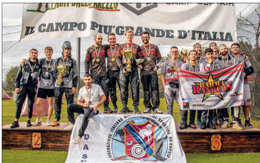
Sul podio anche Fortezza e Rangers.

timi allenamenti di rifinitura, per poi scendere in campo alle 9.00 di domenica, dopo la riunione dei capitani. Durante la mattinata e nel primo pomeriggio si sono svolte le fasi a gironi, mentre nel tardo pomeriggio le finali con le successive premiazioni. Le partite dei gironi hanno portato Rangers, Latin Kings, Dead Bunker,