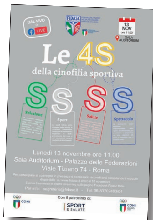
La locandina del convegno dello scorso 13 novembre.

L'attività sportiva cinotecnica costituisce uno dei pilastri fondanti della Federazione, che da sempre attribuisce grande importanza agli sport che vedono l'uomo affiancato dal proprio compagno a quattro zampe. Oggi la Fidasc, con fermezza, autorevolezza e