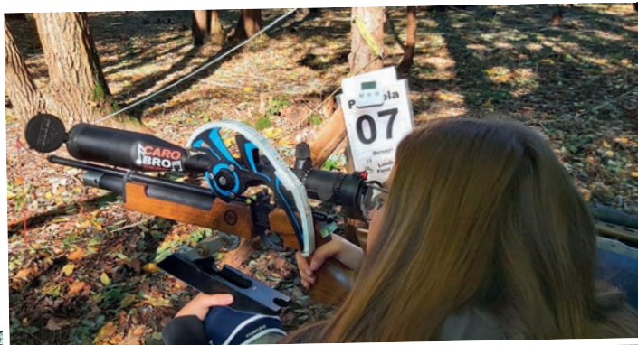
Altri scatti nel pieno della competizione.