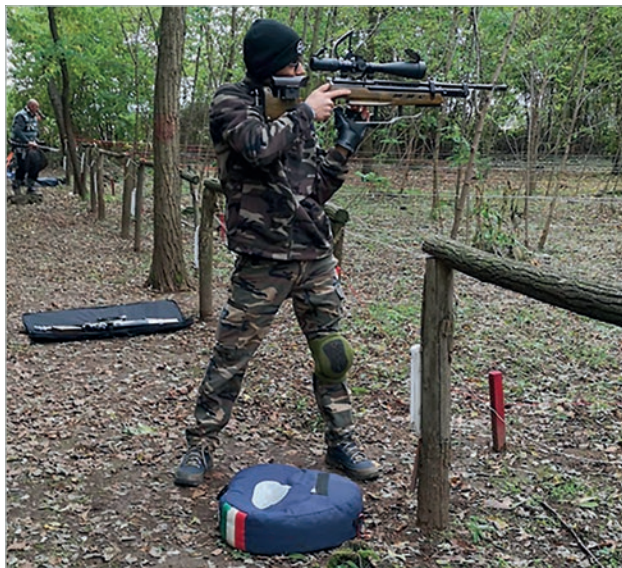
Queste competizioni a livello regionale sono "propedeutiche" agli allenamenti in vista dei grandi eventi.