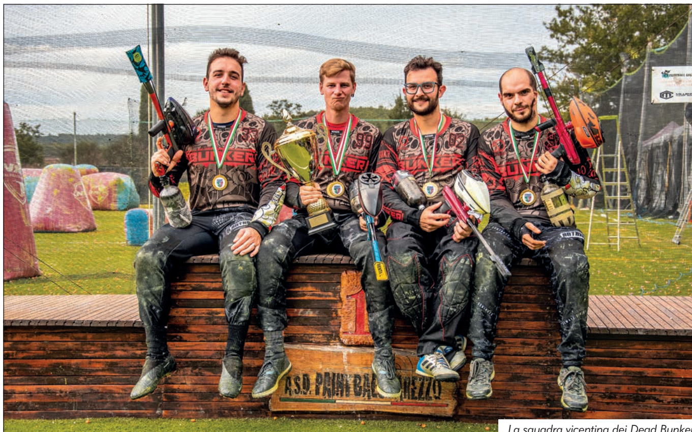
La squadra vicentina dei Dead Bunker.

La finalissima di questo avvincente Campionato si è articolata sul campo attrezzato dell'Asd Paintballs Arezzo di Lucignano. Il titolo è andato alla compagine dei Dead Bunker.