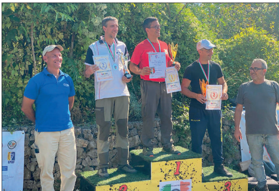
A contendersi i titoli una cinquantina di atleti (uomini, donne, ragazzi) provenienti da tutta la Penisola.

L' 8° Campionato italiano individuale e a squadre di genere di field target ha avuto come teatro di gara l'accogliente campo dell'Asd Vesuvio Field Target di Palma Campania (Na). A contendersi i titoli una cinquantina di atleti (uomini, donne, ragazzi) provenienti da tutta la Penisola. Tra consolidati "professionisti" e nuovi adepti che si sono sfidati senza timori reverenziali. Le giornate sono state gratificate da uno splendido e caldo sole, con temperature estive che hanno stremato non poco i tiratori. La kermesse si è avviata regolarmente e, dopo aver effettuato le operazioni di rito, alle 09:30 del primo giorno, "i giochi" sono stati ufficialmente aperti. Nel contempo un vento, imprevedibile, ha causato seri problemi di interpretazione agli atleti di tutte le categorie. Non