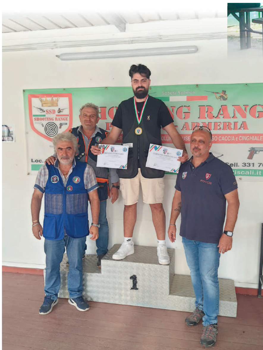
Il podio dell'Assoluto.