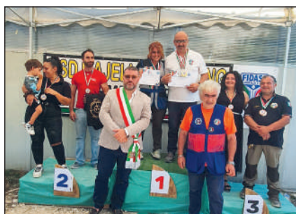
Squadre coppie di genere.