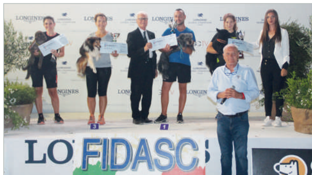
Podio Ko 400