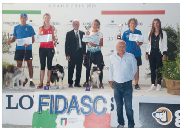
Podio Ko 500