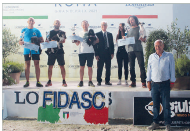
Podio Ko 250