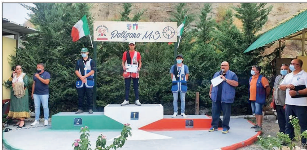
9° Campionato italiano 200 m su sagoma di camoscio