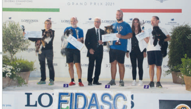
Podio Ko 300