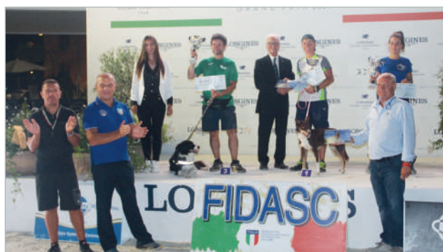
Podio Ko 600

simo dove si è tenuto anche il Longines Global Champions Tour, circuito internazionale di salto ad ostacoli a cavallo che ha avuto tra i protagonisti amazzoni e cavalieri provenienti da tutto il mondo. Il pubblico ha potuto anche ammirare con emozione il tradizionale Carosello dei Carabinieri che con i loro stupendi cavalli si sono esibiti fra gli applausi e lo stupore dei tanti presenti. Una cornice unica nel suo genere all'interno della quale i binomi si sono affrontati in parallelo e sul filo del centesimo di secondo su 11 ostacoli (salti, muri, tubi e slalom) per decretare il campione italiano delle diverse categorie in gara: dalla Ko 250 alla Ko 600 (le classifiche sono visionabili sul sito federale - Ndr). I numeri stanno ad indicare l'altezza al garrese (qui non conta la razza, tutti possono partecipare, anche i meticci) degli atleti a quattro zampe. I più piccoli sono chiaramente velocissimi,