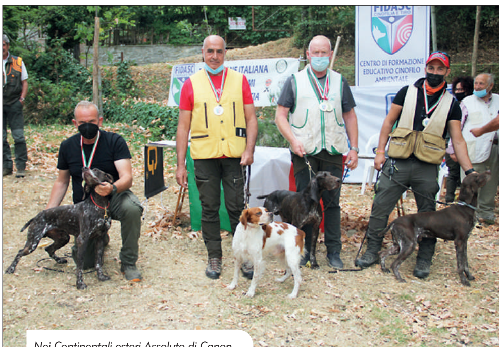
Nei Continentali esteri Assoluto di Canon del Cacic K e negli italiani di Vamos BI.