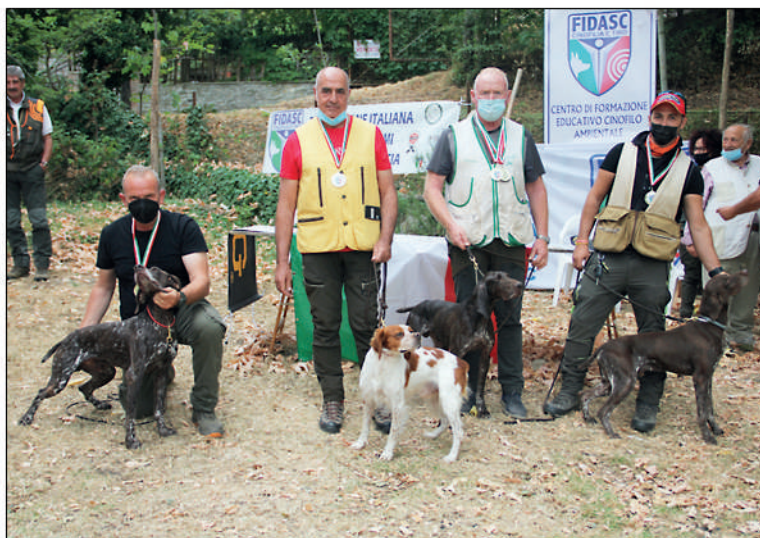
Campionato Assoluto per razze da ferma su selvaggina naturale