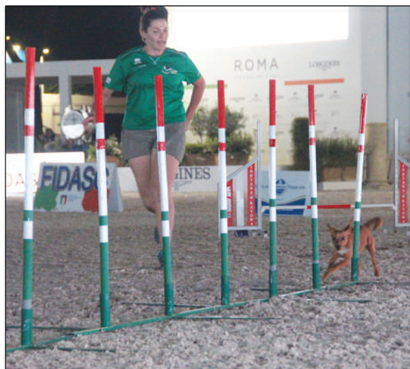
Al Circo Massimo il 3° Gran Prix di Agility Dog