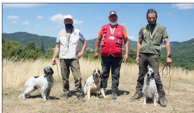
Il barrage Inglese per la medaglia di bronzo e il podio finale.