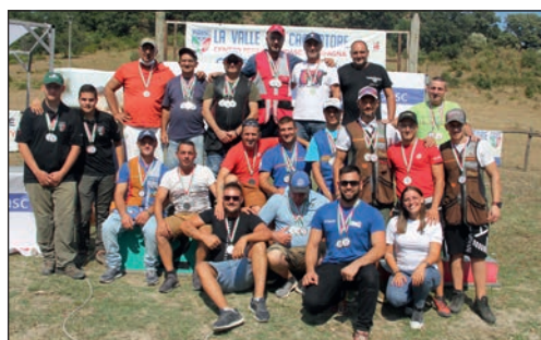
Tutti i medagliati di English Sporting.