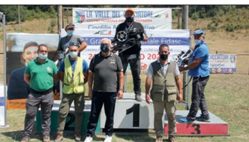
Field Target, ecco i premiati della categoria Depo.