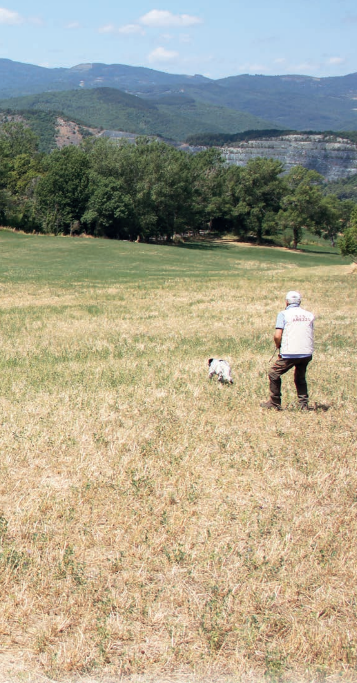
Per la soddisfazione di giudici e dirigenti Fidasc, sono stati presentati quasi 80 cani che rappresentano il top della cinofilia venatoria italiana. Nella foto il barrage degli Inglesi per il primo e secondo posto.