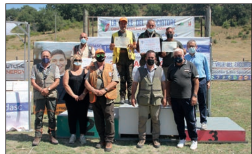
Il podio della categoria Inglese.