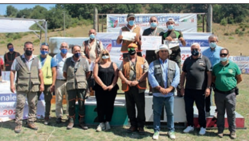
Sul podio i primi classificati nella categoria Continentali insieme con i dirigenti Fidasc.