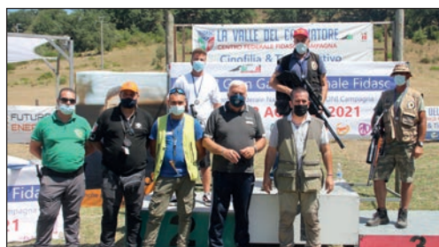
Il podio del Field Target, categoria Full.