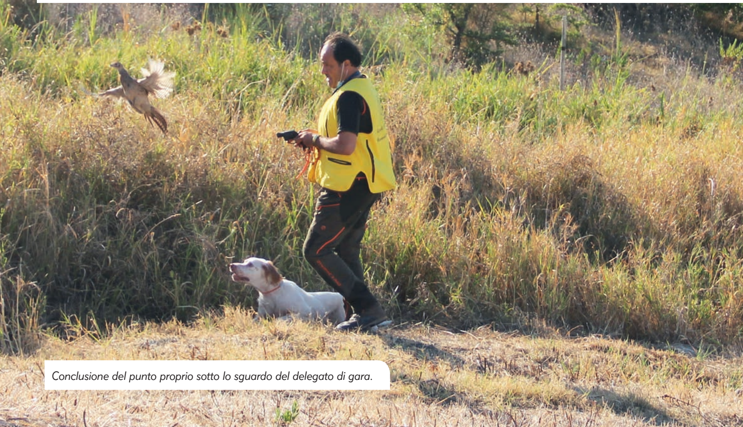
Conclusione del punto proprio sotto lo sguardo del delegato di gara.