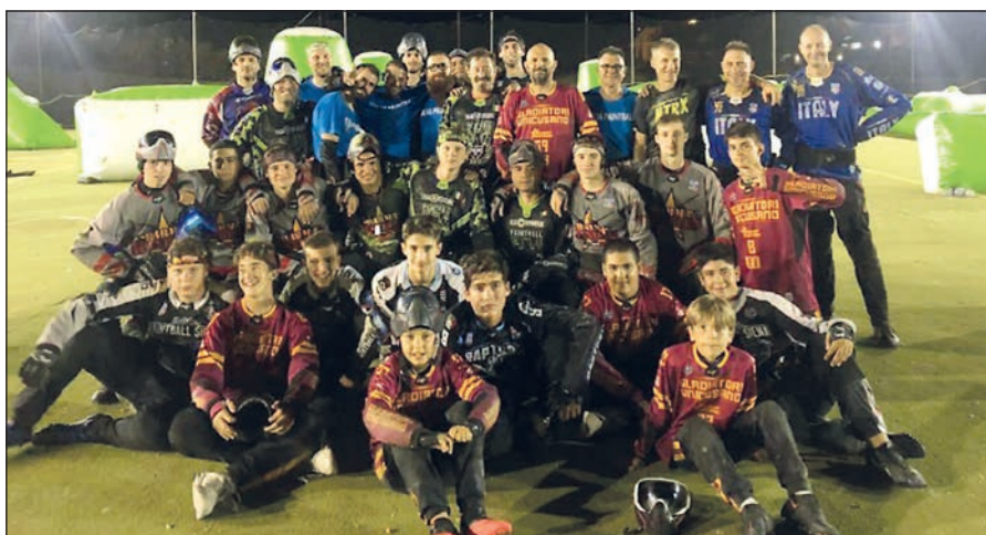
Gli atleti delle nazionali di paintball che saranno impegnate nel Mondiale in scena dal 2 al 5 settembre a Parigi.