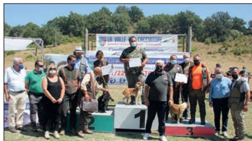
I campioni della Seguita su cinghiale.