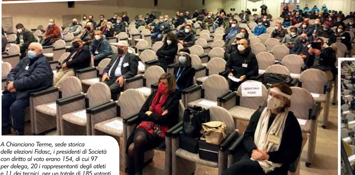
A Chianciano Terme, sede storica delle elezioni Fidasc, i presidenti di Società con diritto al voto erano 154, di cui 97 per delega, 20 i rappresentanti degli atleti e 11 dei tecnici, per un totale di 185 votanti.

A ncora una volta è stata Chianciano Terme (Si) - pur se in un contesto del tutto insolito e dimesso, a causa di questa infinita pandemia - ad ospitare un'Assemblea della Fidasc. Anzi, due. La prima, ordinaria-elettiva e la seconda, straordinaria, per la ratifica