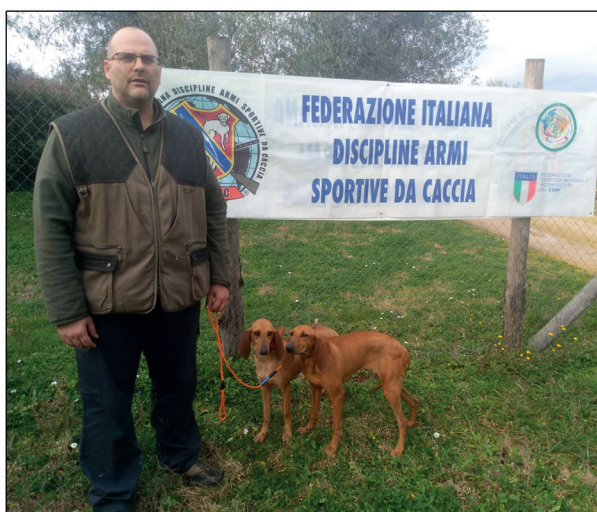
Qualifiche segugi su lepre