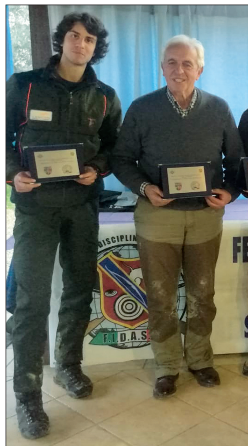
L'organizzazione è stata curata in maniera egregia dalla Asd Etruria in Seguita.