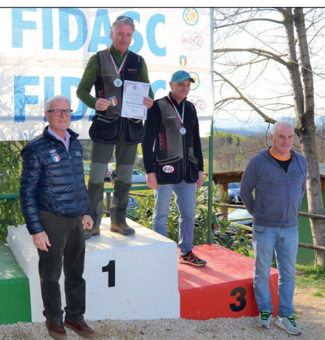
Bizzieri e Cannoni sul podio dei Veterani.