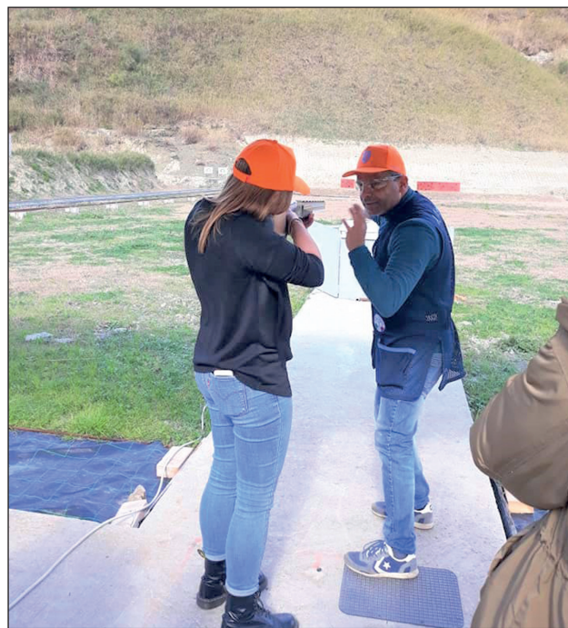
Oltre il tiro a palla, gli appassionati si sono cimentati con il tiro al piattello nella moderna specialità dell'English Sporting con una macchina multidirezionale diavola rossa; la specialità del Field Target praticata con armi ad aria compressa su piccole sagome metalliche e il Tiro di Campagna a 100 metri.

tà rende tutto ancora più importante. Particolarmente significativo, infine, è il fatto che l'attenzione di tutti sia stata rivolta verso gli aspetti legati alla sicurezza e mi auguro che un tale appuntamento possa diventare il primo di una serie da estendere in