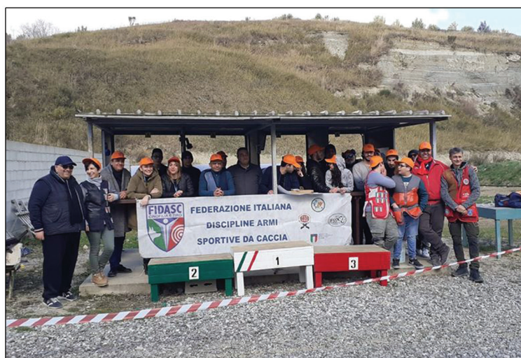
Open Day del Tiro in Calabria