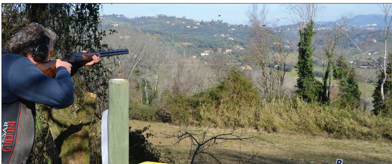
La stagione si apre con l'English Sporting