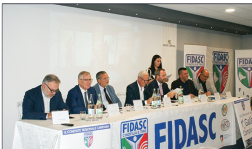
Gran Galà dei campioni campani