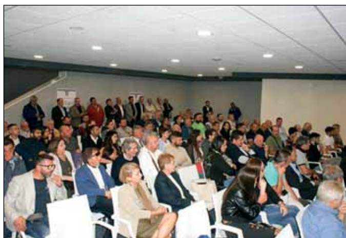
Molti i partecipanti, comprese alcune giovani leve federali.