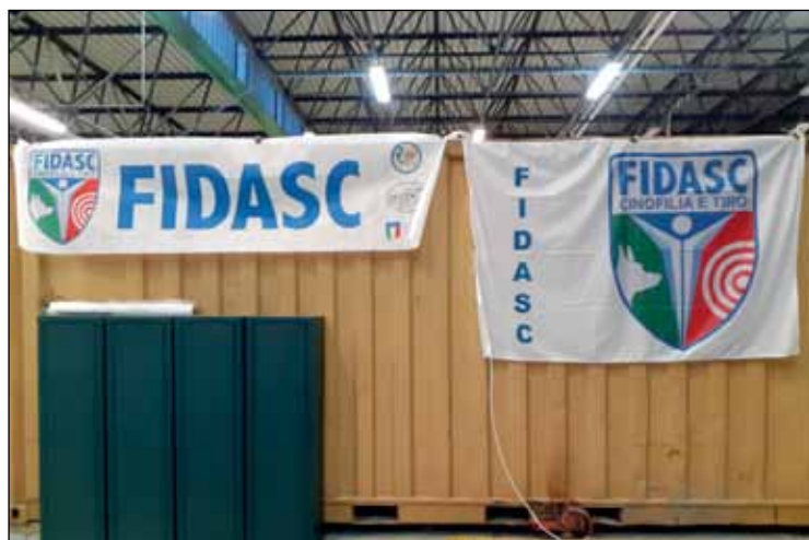
Le prove sono state effettuate in un apposito locale con accessi controllati per la verifica della idoneità dei partecipanti (possesso di regolare licenza e copertura assicurativa), ed un robusto e collaudato sistema parapalle.