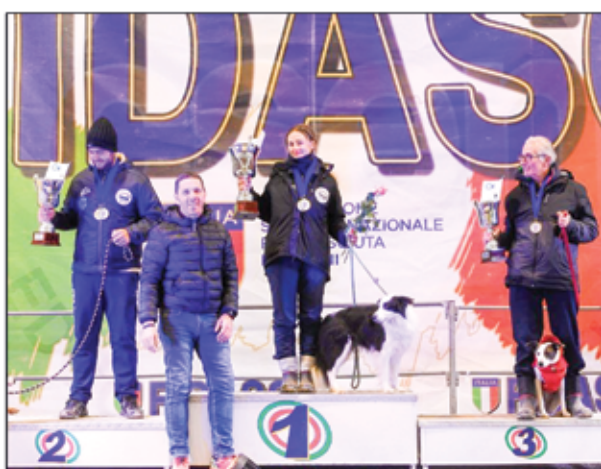
Campionato italiano assoluto di agility