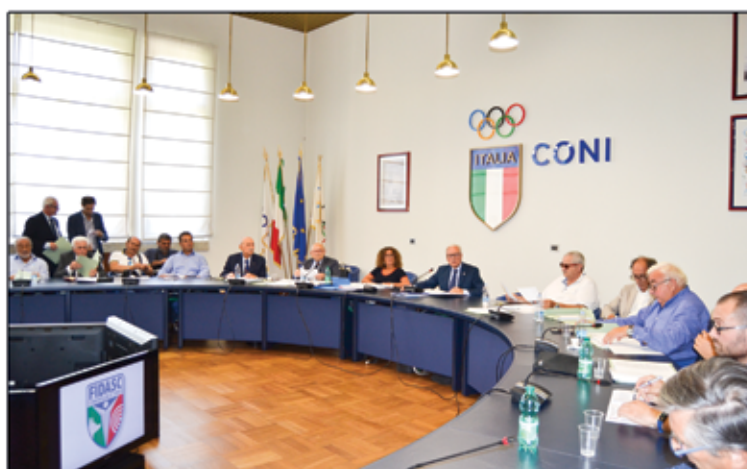
Sport e Fidasc, una visuale diversa