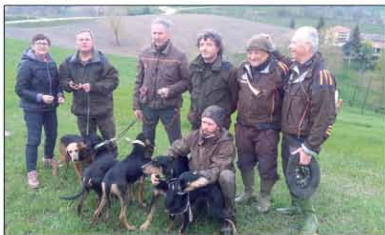
19° Campionato italiano seguita su lepre Coppie e Lady