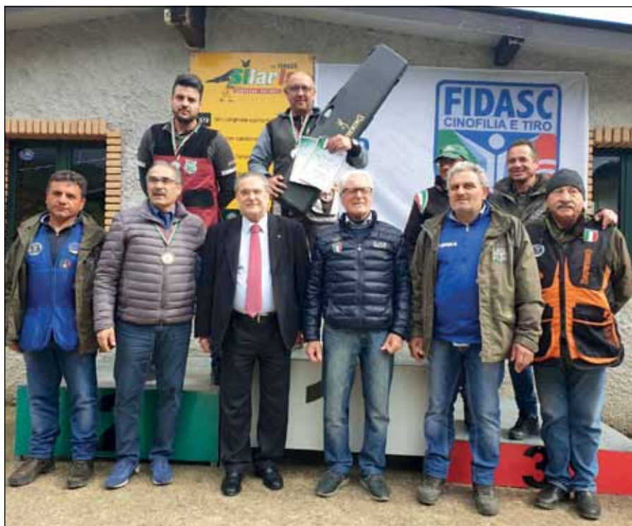
Un podio che vale doppio: è quello, infatti, sia dell'Eccellenza, sia della classifica generale.