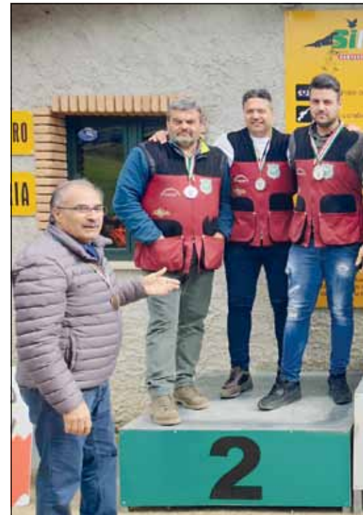
23 e 59 è il distacco che ha inflitto la Campania rispettivamente a Basilicata e Lazio.