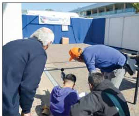
La Fidasc all'Hunting Show Sud