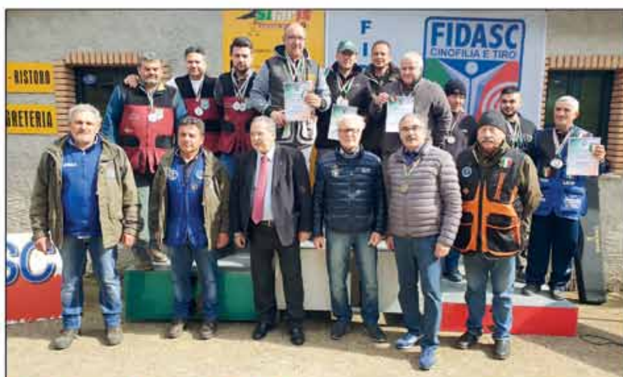
15° Campionato italiano di tiro di campagna 100 m