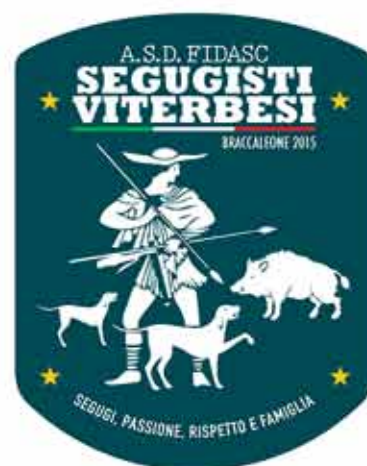
Prove di seguita nel Viterbese