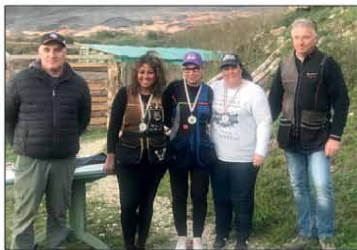
1° Gran premio di english sporting