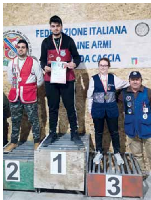
Junior men & Lady