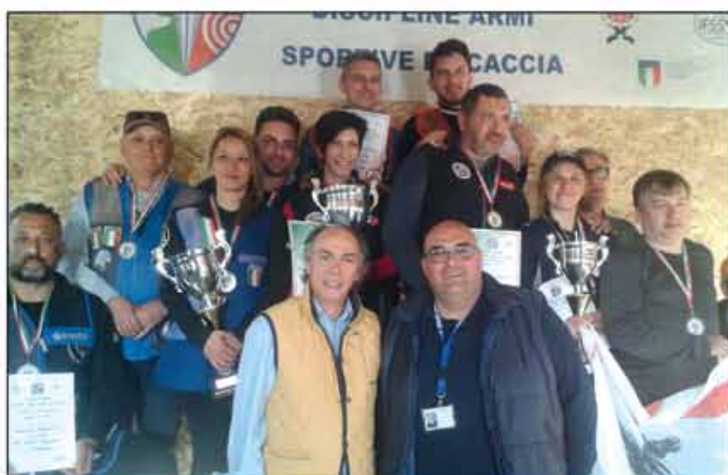
2° Campionato italiano di tiro a palla per squadre regionali