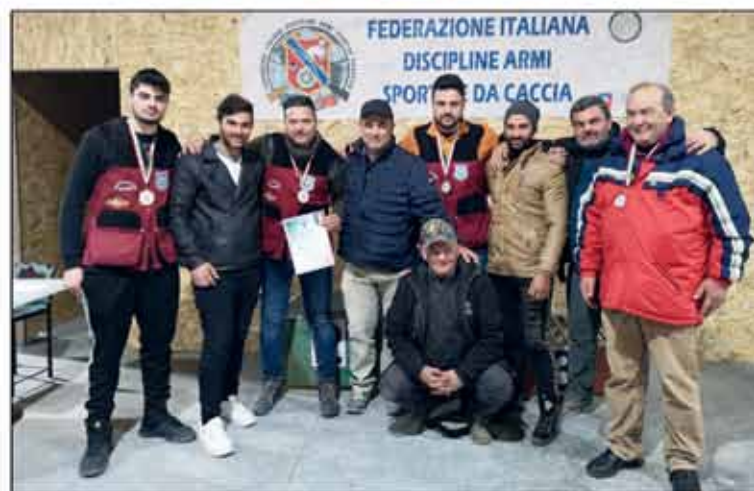
5° Campionato italiano invernale completo di tiro di campagna