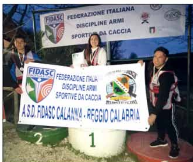
5° Campionato italiano di tiro di campagna 50 m