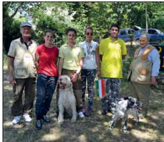
1° Campionato italiano Premium