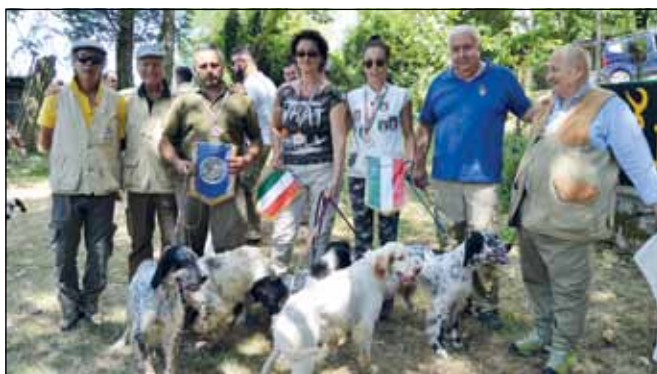
Chiude il podio delle squadre Inglesi il Lazio.