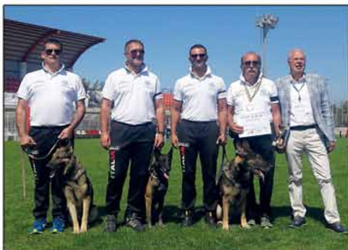
Mondiali per conduttori e cani da soccorso