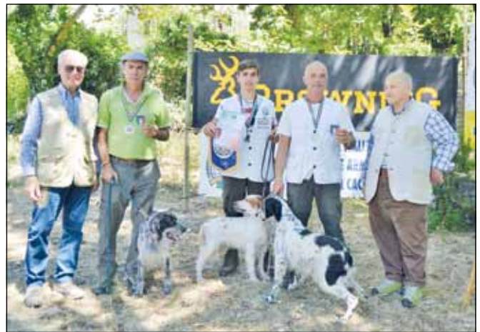
Il Lazio è la squadra tricolore negli Inglese.