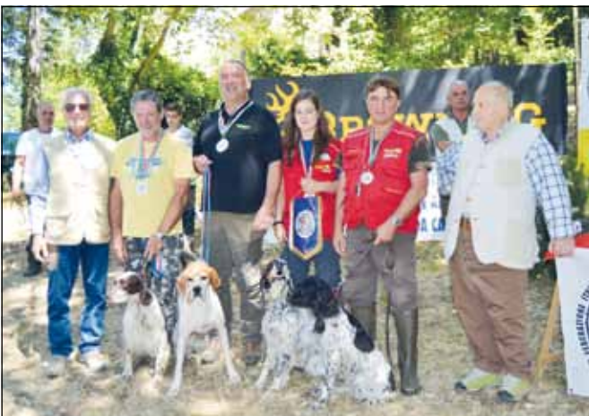
Solo un punto di distacco per la Toscana, seconda negli Inglese.