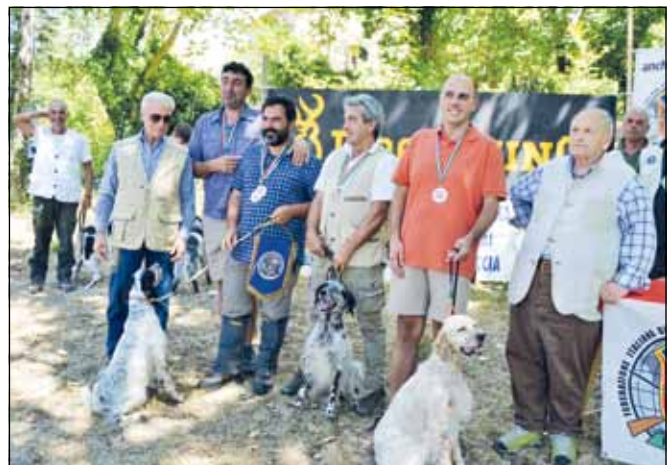
8 punti valgono il bronzo negli Inglese per la Liguria.