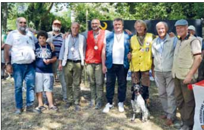
Bronzo per la Lombardia nei Continentali esteri.