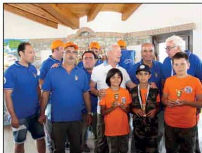
Giornata di sport dedicata ai giovani nel Cosentino