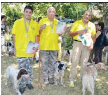
L'Emilia-Romagna è la squadra campionessa italiana negli Inglesi.

Anche qui la gara si è dipanata su un'unica batteria di 7 turni, affidata ancora al giudizio di Luigi Chiappetta.