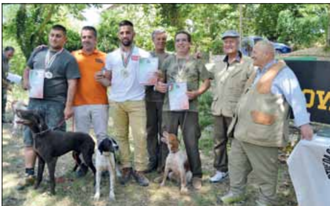
La Campania aggiungerà la vittoria a squadre nei Continentali esteri al suo già ricco palmares.