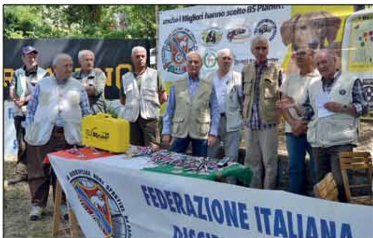
17° Campionato italiano Assoluti