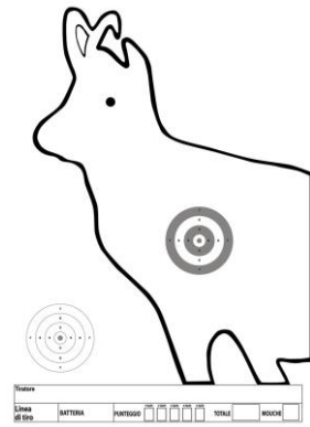
Specialità 200 mt – Tiro con appoggio