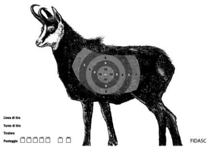
Specialità 100 mt – Tiro in 4 posizioni